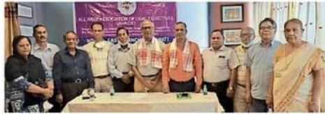
बैठक में उपस्थित कोल पेंशनर।